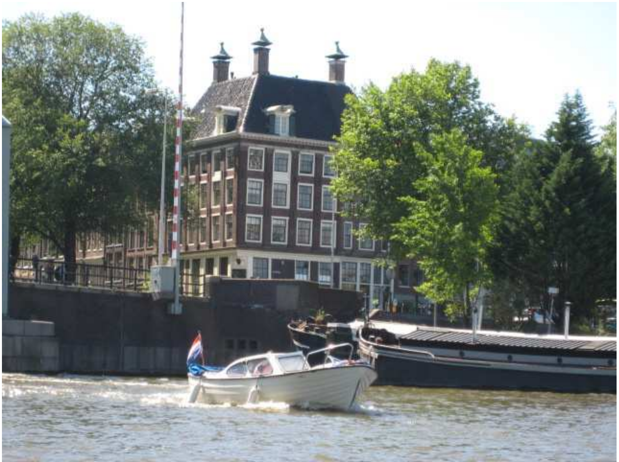
Prins Hendrikkade 156 Amsterdam